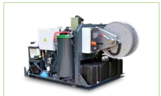
INBOUWUNIT voor inbouw in bestelwagen of vrachtauto