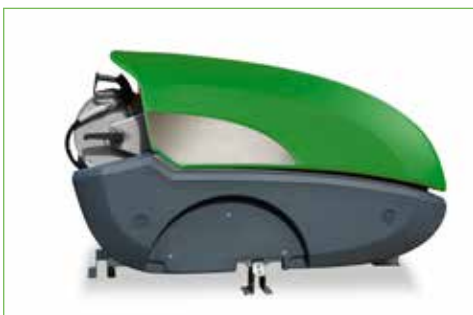
SKIDUITVOERING voorzien om op te tillen met een forklift

T = Trailer niet geremd, I = Inbouwunit, S= Skiduitvoering