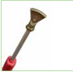
Stoomlans code: 1.230.18x