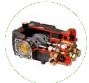
Radiale krukaspomp met messing pompkop, keramische plunjers en RVS kleppen